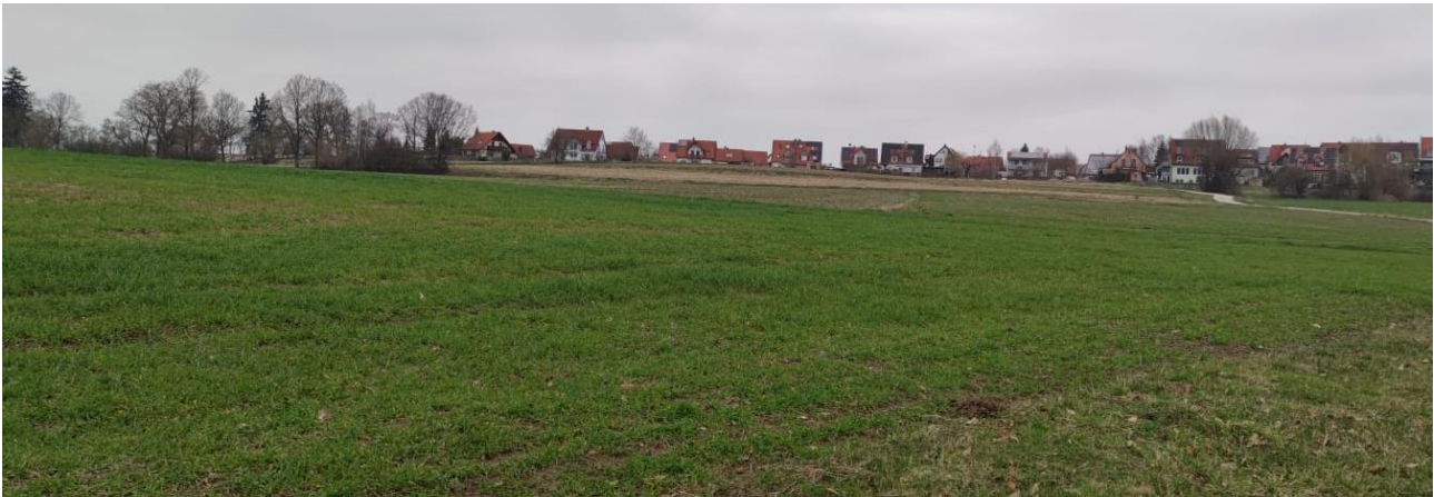
Abbildung 3: Das Vorhabensgebiet, Blick nach Norden