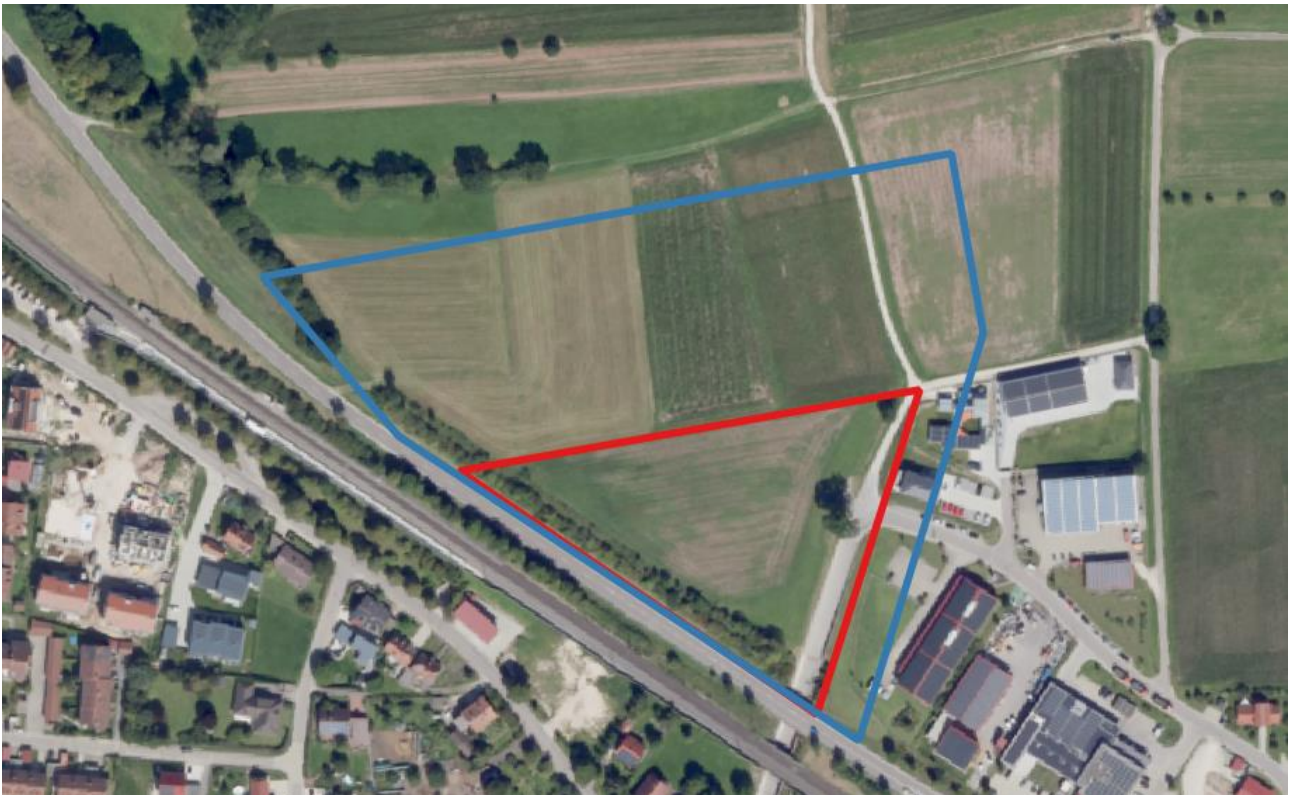
Abbildung 2: Übersicht über das Untersuchungsgebiet; (Luftbild: LBDV)

In Muhr am See will der Elektrobetrieb Loy sein Firmengelände auf die nördlich angrenzende, ca. 0,85 ha große Fläche erweitern. Da die Wirkung eines Bauvorhabens meist über das Vorhabensgebiet hinaus reicht, wurde das Untersuchungsgebiet, innerhalb welchem kartiert wurde, weiter gefasst (Abb.2).