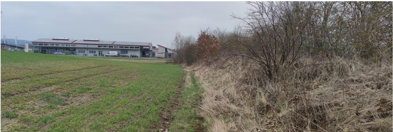
Abbildung 4: Der Heckenzug. Im Hintergrund der Elektrobetrieb